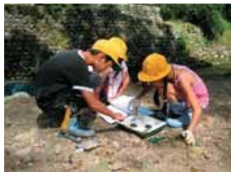
▲栃津川の水質調査。きれいな水に住む生き物が見つかりました。

黒谷川は人の手で川底をコンクリートにして作り変えられた川です。栃津川より流れがゆるやかで水量の変化も少なく、たくさんの生き物がいてびっくり! 生き物がすみやすいよう工夫して作られています。