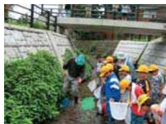
▲地域の人と生き物調査。たくさんの魚が見つかりびっくり!