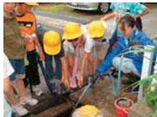
▲見て、触って、冷たくておいしいと感じた井戸水。