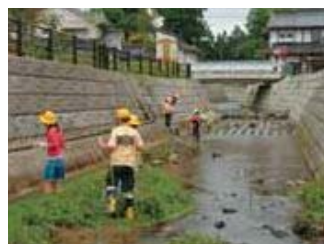
▲黒谷川では、栃津川と違う生き物が見つかりました。