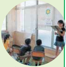
▲ポスターセッションで情報交換。

わたしは、栃津川の水量について調べてきました。これから、冬の水の深さをはかり、春になるまで調べてみたいです。また、冬になり、寒いので魚がすごしくくなります。教室で世話をしている魚の世話をしているのか、逃がした方がいいのか、みんなで考えていきたいです。