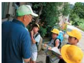
▲地域の方に井戸水についてインタビュー。