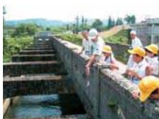
▲用水の仕組みについてお話を聞きました。