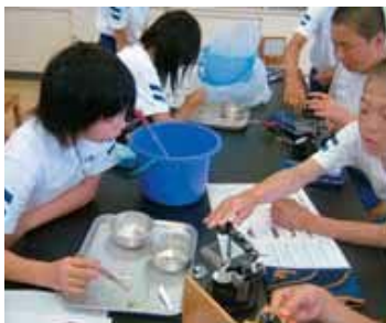
▲水生生物の種類をもとに水質を調べました。