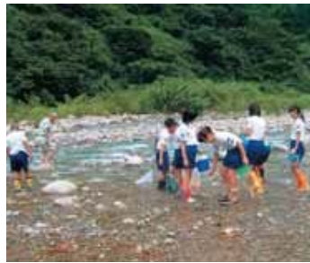
▲片貝川上流で水生生物調査をしました。