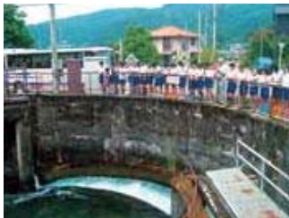
▲片貝川の水が鴨川へ分水されています。

鴨川で水生生物調査や水質検査をしました。鴨川清掃をしているのに、水は少し汚れているという結果でした。自分がゴミを捨てないことはもちろん、地域の人にも呼びかけていきたいです。そして、たくさんの人と協力して、サケがたくさん戻ってくる鴨川にしたいです。