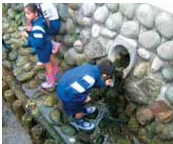
▲鴨川の排水の水質検査をしました。