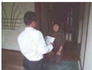
▲鴨川について総合学習で調べたことを鴨川新聞にまとめて、地区の皆さんに配りました。